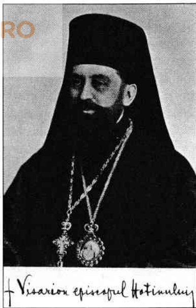
Visarion Puiu, arhiepiscop de Bălți și Hotin

Așadar, în perioada 1941-1944 am locuit la Bălți. Războiul să îndepărtase de noi, ajunsese la Stalingrad, după care a început să se apropie din nou. Era limpede ce ne aștepta.