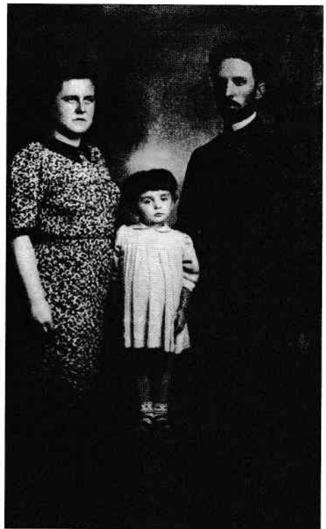
Familia Balaur în refugiu. București, 9 august, 1940

Tata și-a reluat postul de consilier cultural și redactor la revista „Biserica Basarabeană”. Preocupat de soarta tragică a multora dintre