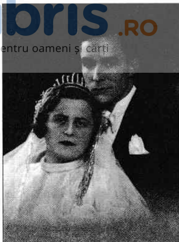
Chișcăreni, 28 februarie 1937

pe lună sau la două luni, și venea cu butiile încărcate, uneori pentru un an de zile. Cu rușii nu aveam absolut nici o legătură. Nu era nici un rus, nu auzai nici o vorbă rusească. Erau moldoveni, ca pe vremea lui Alexandru cel Bun, Ștefan cel Mare, Dimitrie Cantemir. Moldova era absolut curată, ca și cum nici nu era sub stăpânire străină.