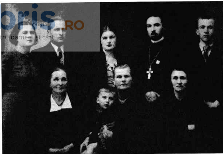
Botezul Elenei. Paști, 1938

În ziua de 27 iunie 1940 tata și mama se aflau la cinematograful din Bălți, vizionând filmul – culmea! – „Bestia roșie”; un film documentar ilustrând atrocitățile din URSS. După film au plecat acasă. Habar n-aveau că guvernul român, constrâns, acceptase ultimatumul.