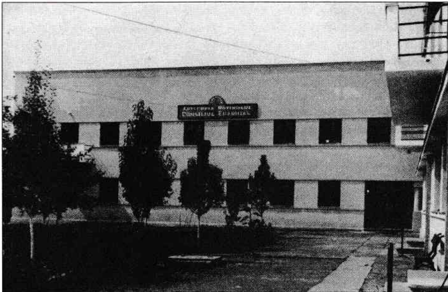
Sediul Episcopiei din Bălți

A urmat un proces care s-ar fi vrut grandios. Cu... „legionari” (nimic nou sub soare), mai ales că biserica avea hramul Sfinților Arhangheli Mihail și Gavriil, și cu... complot împotriva statului comunist. La proces, în boxă, au apărut vreo 12 persoane care nu aveau