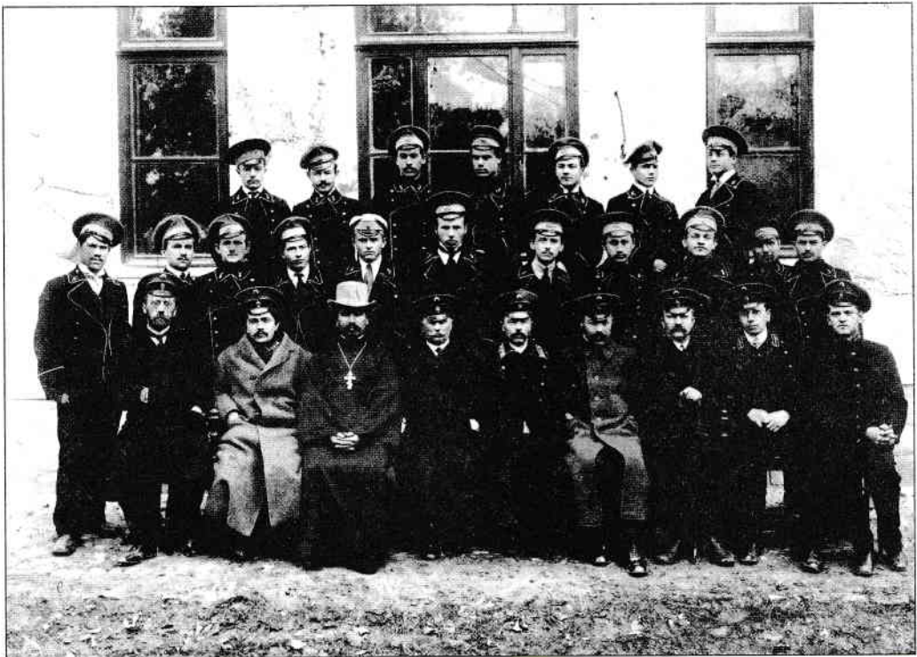
Promotia anului 1912, Seminarul Teologic din Chișinău